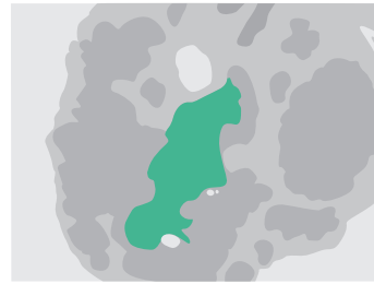
FIGUUR 2. Speekselklierbiopsi: seromucineuze klierbuizen, waartussen plaatselijk fibrose en lokalisatie van lymfocyttaire haardjes, plaatselijk bijgemengd met plasmacellen. (HE-kleuring; 150 maal vergroot.)

waarschijnlijk niet of minder van belang waren) zijn een verminderde corticale \text{Na}^+ -reabsorptie en een toegenomen doorlaatbaarheid van de celmembraan in de distale tubulus met als gevolg toename van \text{H}^+ -terugdiffusie.